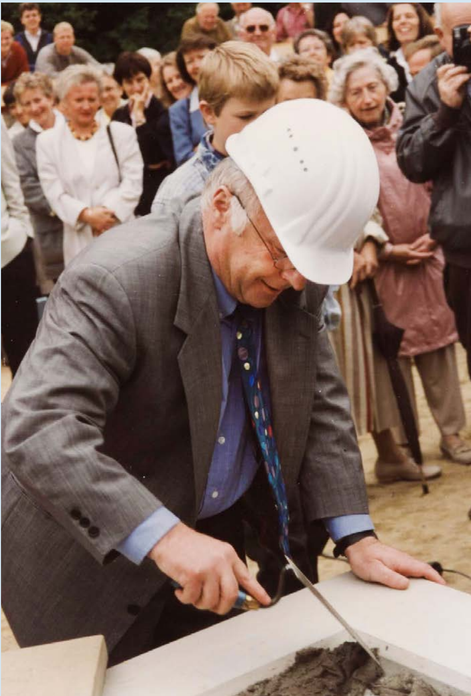
Bundesarbeitsminister Norbert Blüm (1935 – 2020) bei der Grundsteinlegung des Franziskus-Hospiz Hochdahl am 25. Juni 1993.