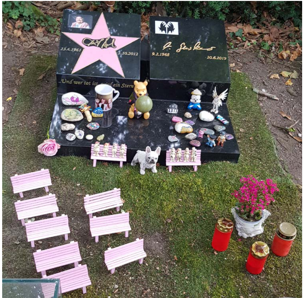
Die Ruhestätte des Kölner Comedian Dirk Bach (1961-2012) auf dem Melatenfriedhof – sie wechselt immer wieder ihr buntes Gesicht.

Auf der „Straße der Millionäre“ - einer der Friedhofs-Hauptachsen - haben nicht nur Kölns Prominente aus Wirtschaft und